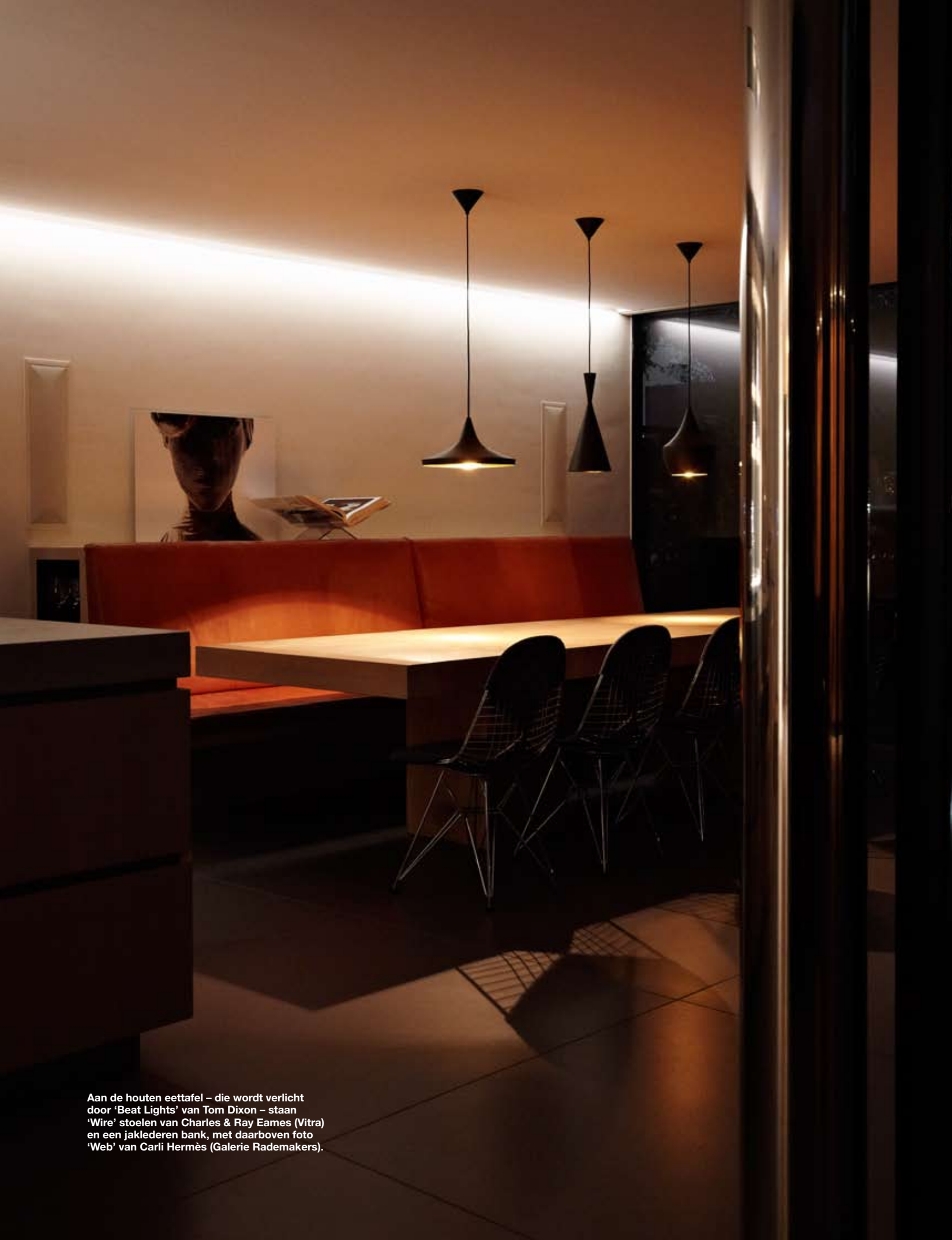
Aan de houten eettafel – die wordt verlicht door 'Beat Lights' van Tom Dixon – staan 'Wire' stoelen van Charles & Ray Eames (Vitra) en een jaklederen bank, met daarboven foto 'Web' van Carli Hermès (Galerie Rademakers).