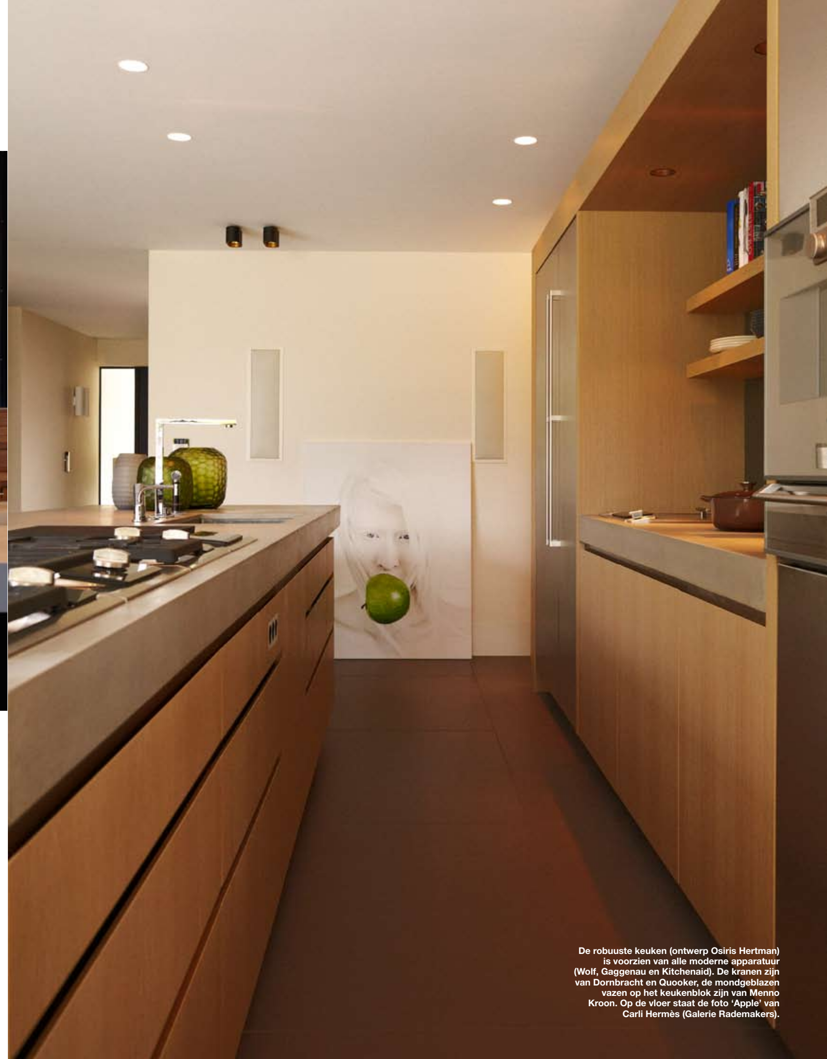
De robuuste keuken (ontwerp Osiris Hertman) is voorzien van alle moderne apparatuur (Wolf, Gaggenau en Kitchenaid). De kranen zijn van Dornbracht en Quooker, de mondgeblazen vazen op het keukenblok zijn van Menno Kroon. Op de vloer staat de foto 'Apple' van Carli Hermès (Galerie Rademakers).

Het materiaalgebruik laat de grenzen tussen binnen en buiten vervagen.