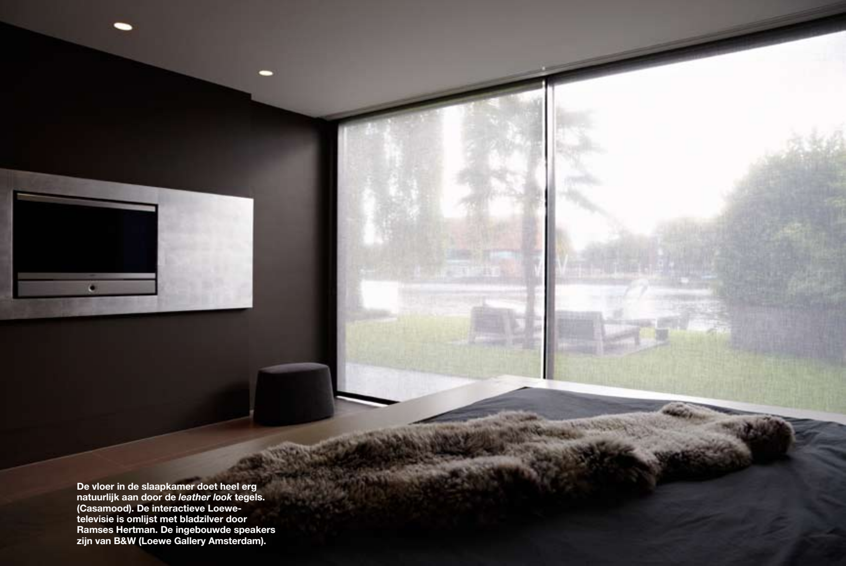
De vloer in de slaapkamer doet heel erg natuurlijk aan door de leather look tegels. (Casamood). De interactieve Loewe-televisie is omlijst met bladzilver door Ramses Hertman. De ingebouwde speakers zijn van B&W (Loewe Gallery Amsterdam).

in en op het water, is geen grote verrassing. Dit huis is een spa op zichzelf. De ringleiding levert een hoge waterdruk en direct warm water op elk punt in het huis. Er is een patio met een warmwaterkraan, een buitendouche en een sauna, een badkamer voor de kinderen met op maat gemaakte Crystalplant-wastafel van Marike, en een hoofdbadkamer met een door led verlichte jacuzzi en twee 'Big Rain'-plafonddouches van Dornbracht. Zelfs de gastenbadkamer is om jaloers op te zijn. Het begrip 'regendouche' krijgt een heel andere betekenis als je douchet onder een glazen plafond, terwijl de regen boven je hoofd klettert.