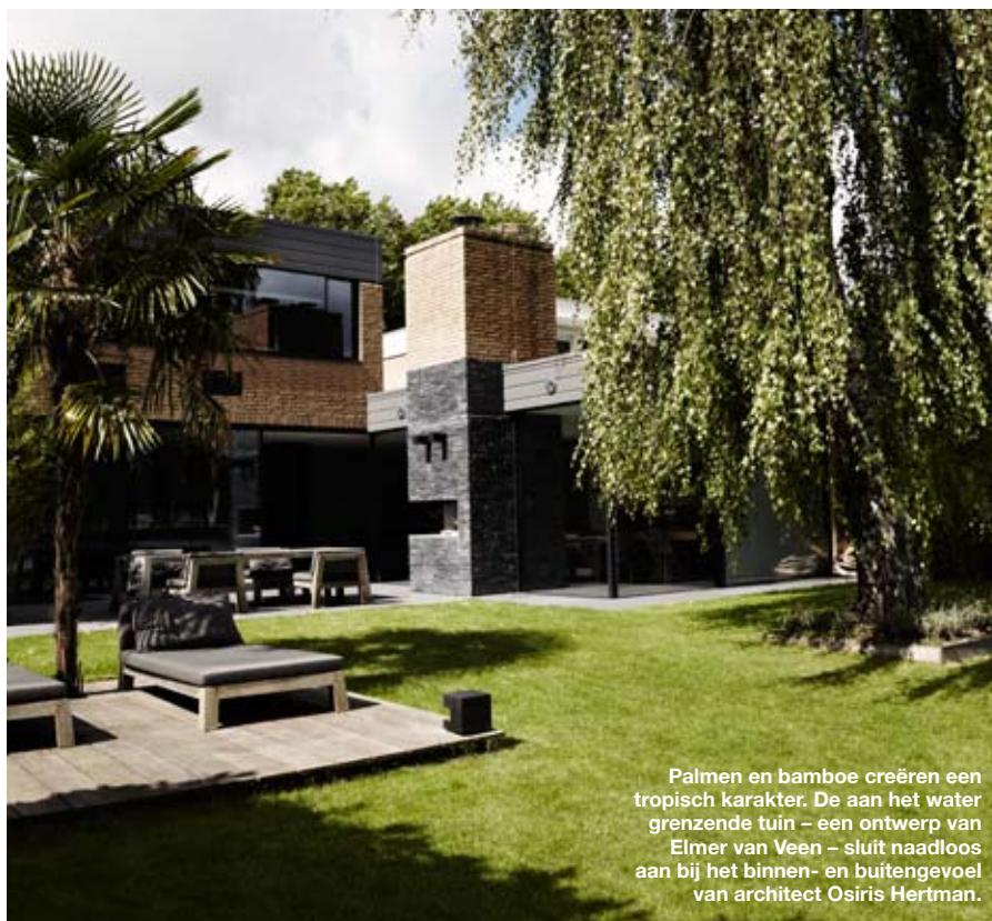
Palmen en bamboe creëren een tropisch karakter. De aan het water grenzende tuin – een ontwerp van Elmer van Veen – sluit naadloos aan bij het binnen- en buitengevoel van architect Osiris Hertman.

"Alles is op maat gemaakt, de constructies zijn overal verborgen en we hebben voor alle mogelijke details een passende oplossing gevonden. Het moet allemaal perfect zijn, en daar besteed ik dan ook veel tijd en aandacht aan. Het is ook niet zo dat er door het hele huis knopjes zitten om te laten zien hoe gaaf en hightech het is. Het moest gewoon een leefbaar en volmaakt huis worden en dat is zeker gelukt." ✨