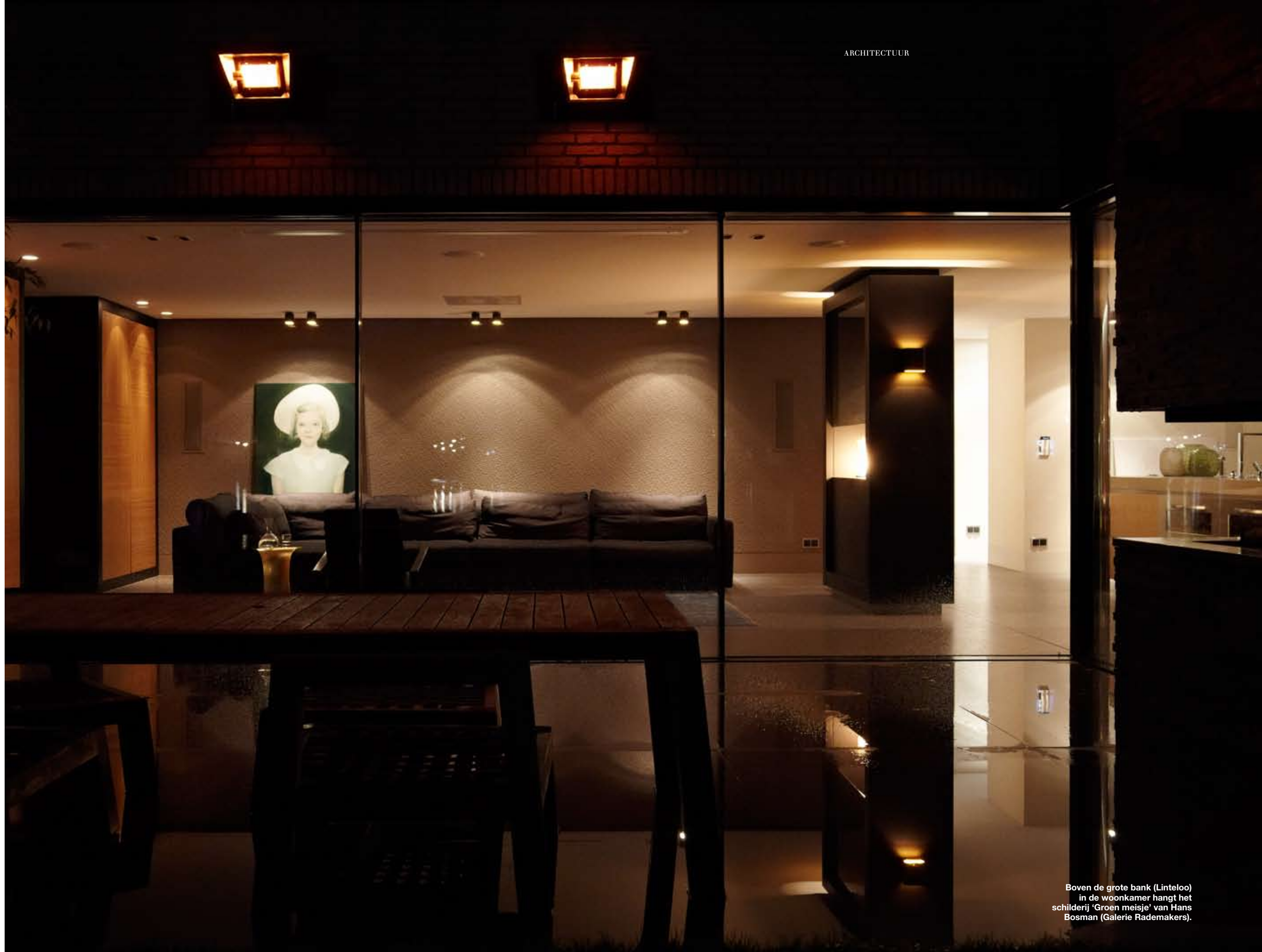
Boven de grote bank (Linteloo) in de woonkamer hangt het schilderij 'Groen meisje' van Hans Bosman (Galerie Rademakers).

Het jonge gezin heeft duidelijk oog voor natuurlijke schoonheid. Het huis is vooral opgetrokken uit natuurlijke materialen: tegels met een aaibare oppervlaktestructuur, de vloer en traptreden van massief zwarte kabbes-hout, een eetbank bekleed met jakleder uit Tibet, de kiezelwanden in de badkamer en de garagedeur van knap in elkaar gestoken cederhouten panelen.